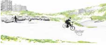
2012 De Hollandse Kustplaats, iov Atelier Kustkwaliteit