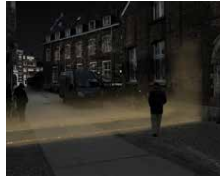
2016 Leuven Stadsomwalling, iov Gemeente Leuven