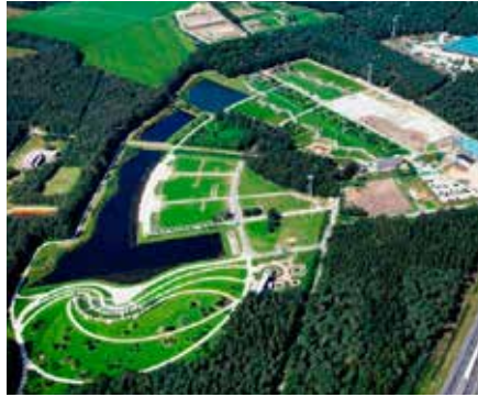
2008 Floriade Venlo ontwerp basispark Copijn tuin- en landschapsarchitecten Utrecht