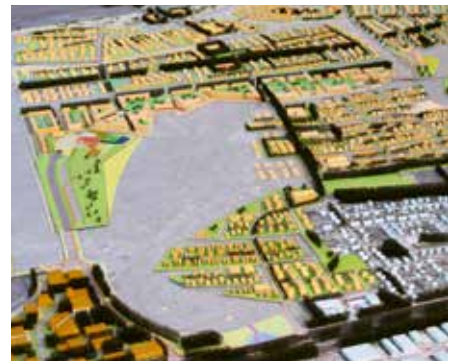
2010 Landschappelijk Raamwerk Waterrijk Almelo Hosper landschapsarchitectuur en stedenbouw Haarlem