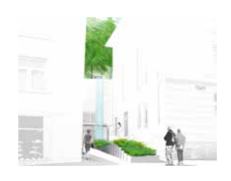
2013 Oasis Urbain, geselecteerd voor Lausanne Jardin Festival