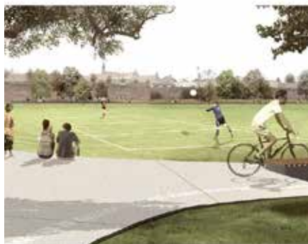
2015 Park ter Walle Menen, iov gemeente Menen