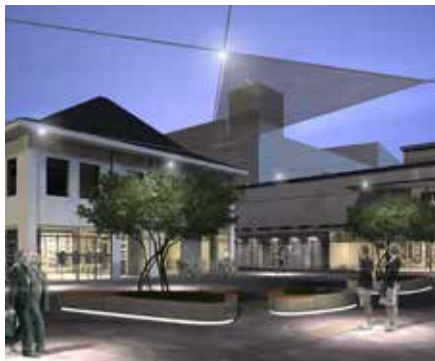
2011 Paderborn Königsplatz Hosper landschapsarchitectuur en stedenbouw Haarlem ism Foundation 5 architecten