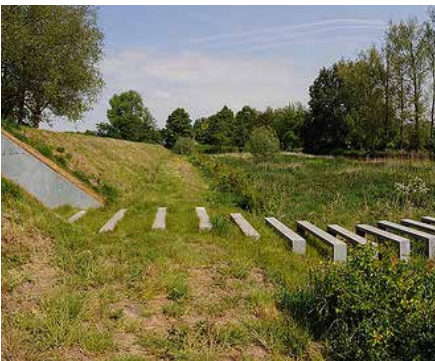
2006 Gedekte Gemeenschapsweg OKRA landschapsarchitecten Utrecht