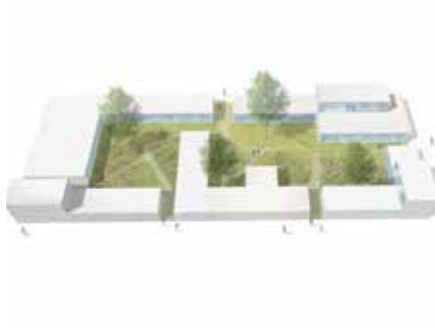
2015 Hof van Cartesius, stedenbouwkundig plan Utrecht