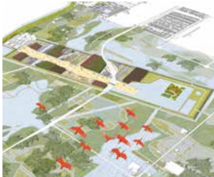
2007 Dredge Landscape Park, eerste prijs International Archiprix