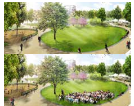
2010 Antwerpen Harmoniepark Hosper landschapsarchitectuur en stedenbouw Haarlem