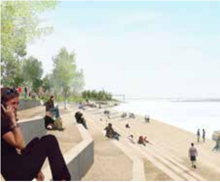
2009 Embankment Park Perm Rusland Hosper landschapsarchitectuur en stedenbouw Haarlem ism KCAP Rotterdam