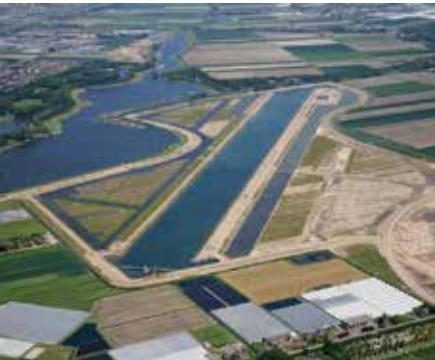
2007 Eendragtspolder Rotterdam Copijn tuin- en landschapsarchitecten Utrecht