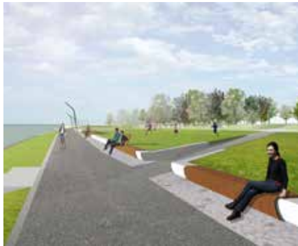
2011 Fuxin city park China Hosper landschapsarchitectuur en stedenbouw Haarlem ism Frontier Design architecten