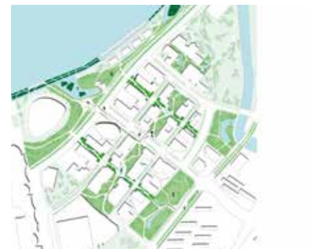
2015 Shanghai Greenways, Passages competition