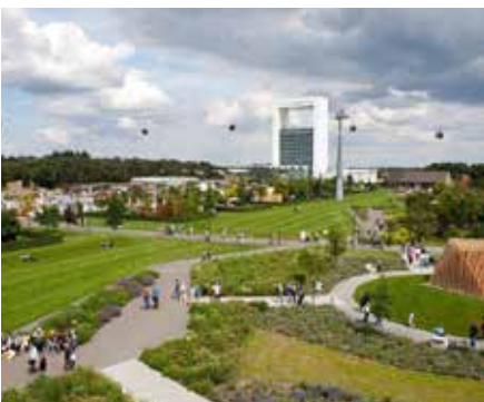
2008 Floriade Venlo ontwerp basispark Copijn tuin- en landschapsarchitecten Utrecht