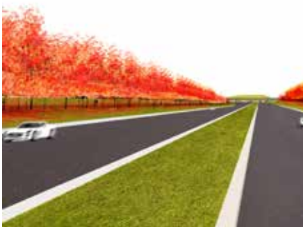
2011 Legacy of Olmsted, eervolle vermelding Montreal Gateway Competition