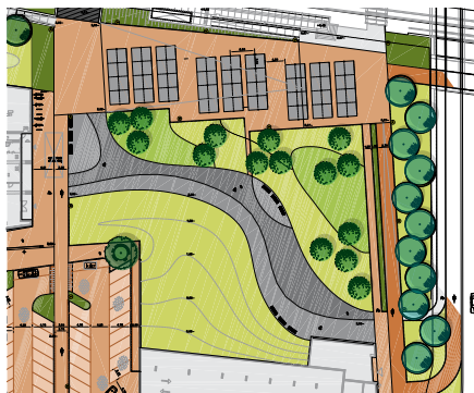
2007 Stationsplein Pijnacker Copijn tuin- en landschapsarchitecten Utrecht