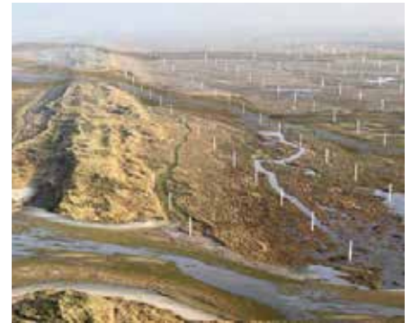
2008 Interaction between the elements Terschelling Rietveld Landscape Amsterdam