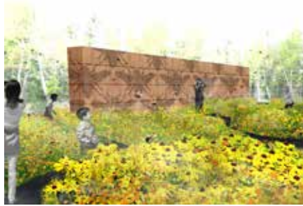
2013 BEEhaviour, Allariz Spanje, uitgevoerd, opgenomen in Jaarboek Landschapsarchitectuur en Stedenbouw 2013