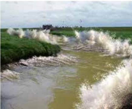
2011 Human Nature Spuisluis, iov Atelier Rijksbouwmeester Ytje Feddes