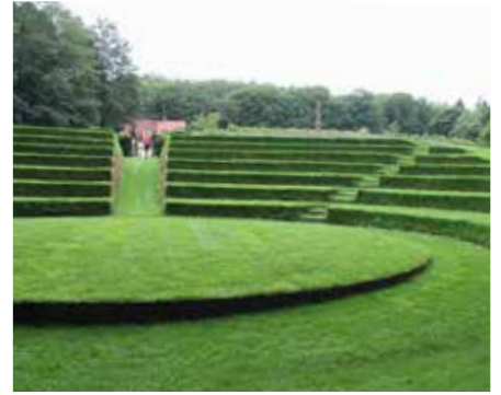
2008 Amfitheater Laag Oorspong Oosterbeek Copijn tuin- en landschapsarchitecten Utrecht